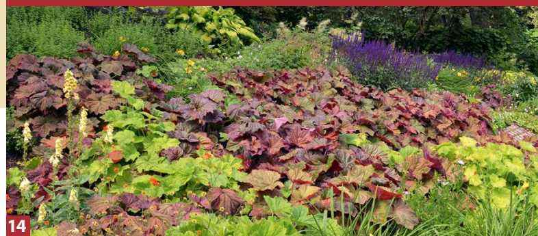
Bund deutscher Staudengärtner, August 2017 · Text: Bernd Hertle · Gestaltung und Redaktion: Marion Manig Grafikdesign

Mehr zu Heuchera unter www.staudensichtung.de Lieferpartner unter www.bund-deutscher-staudengaertner.de